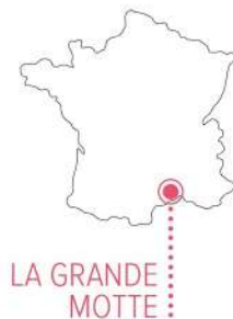
LA GRANDE MOTTE

driehoekig gebouw aan de haven met balkons waarvan de zijkant opbolt als een bikini en balkons die aan de onderkant de vorm hebben van een mannenzwembroek. De architect hanteerde bij zijn ontwerpen vaak de gulden snede, de ideale verhouding van hoogte en breedte, maar hij besteedde ook aandacht aan luxe en comfort en gaf prioriteit aan voetgangers en fietsers. Ook schreef hij een boek over zijn vrolijke stad met de veelzeggende titel: La Grande Motte: l'architecture en fête . Er is overigens één hotel dat geen piramidevorm wilde, maar een rechthoekig blok: het hotel Mercure Port. Het is nog eerder geel dan wit ook. En jawel, daar logeren wij. Zo'n spitse top betekent te veel ruimteverlies aan de bovenkant, vond de Accor Groep.