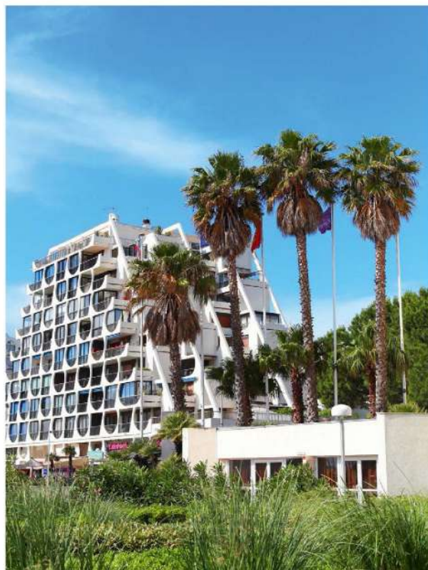
94 LEVEN IN FRANKRIJK